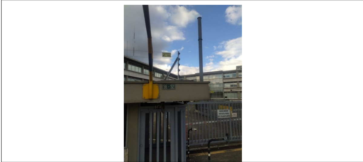
Foto No. 2 – Vista del mástil y de la nomenclatura del predio dende se encontraba instalada la valla.